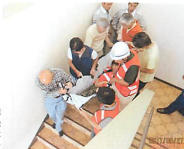
階下に運び下ろす実施訓練

用した用具は『メガムバー』という折り畳み式簡便搬送器具です。担架は階段の踊り場をうまく回転できませんがメガムバーは容易でした。防災部で5個購入しましたので、みなさん活用してください。